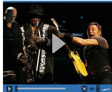
Springsteen funde el calor en Sevilla El 'Boss' abrió su fantástico recital con 'Sevilla tiene un color especial' y 'Badlands'.