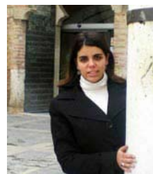
El Graderío de la Catedral