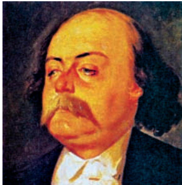
Retrato de Gustave Flaubert pintado en 1856 por Eugène Giraud

La confirmación de que esto era así puede hallarla ahora el lector español en dos libros. Uno, editado por Marbot, reúne la correspondencia entre Gustave Flaubert (1821-1880) y George Sand (1804-1876), seudónimo que ocultaba a la