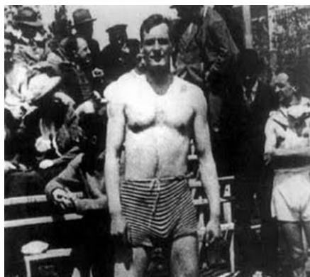
Arthur Cravan, a punto para el primer asalto

Así las cosas, no podemos por menos de celebrar la respetuosa de los cinco números de Maintenant por parte de el olivo azul , así la figura de Cravan para el actual lector en castellano. Más gusto por las rarezas bibliográficas o las personales filias por el F las vanguardias, de este volumen deben interesarnos, a partes tanto el prólogo de Jérôme Gouchet, que nos pone en antec sobre la vida y milagros de Cravan, como los textos en prosa de Cravan, diseminados a lo largo de los cinco números de la Mai entre los que podremos contar un par de contundentes ; personales a André Gide, un encuentro ficticio, desternillante y c apócrifo con un Oscar Wilde —a la sazón, tío del propio Crava graciosísimo libelo contra la llamada “exposición de los indepen en el que no deja títere —ni pintor— con cabeza; así como otro chanzas a costa de Apollinaire y su señora. Los poemas no, los j ni mirarlos. Bien puede ahorrárselos el lector y todo ese tiempo habrá ganado a la eternidad, pero el Cravan prosista, irreverente a bien vale el empeño.