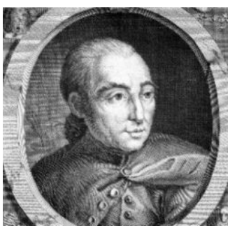
Restif de la Bretonne