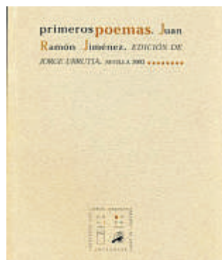
Point de Lunettes

Promocionado a través de una conferencia sobre Alquimia en la Fundación José Manuel Lara, la obra de Dolores de Gual, «Paracelso», es una de las novedades lanzadas por la editorial La máquina china.