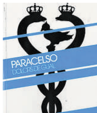
La máquina china

Basada en la guerra de Crimea, la obra del escritor ruso Ivan Shmeliov, «El sol de los muertos», una crónica escrita en 1923 en el exilio parisino del autor, será la próxima novedad europea rescatada por El olivo azul