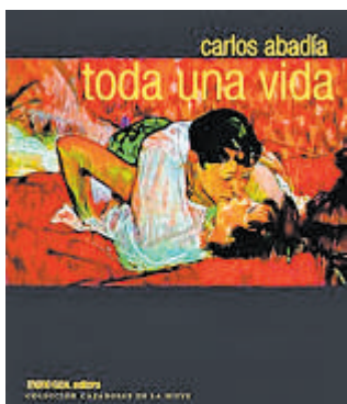
Mono azul editora